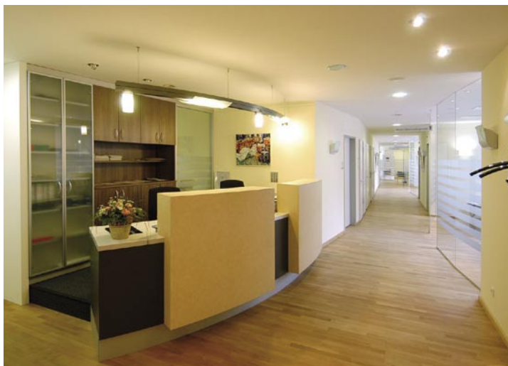
Anmeldebereich im Digitalen Brustzentrum Prüner Gang.